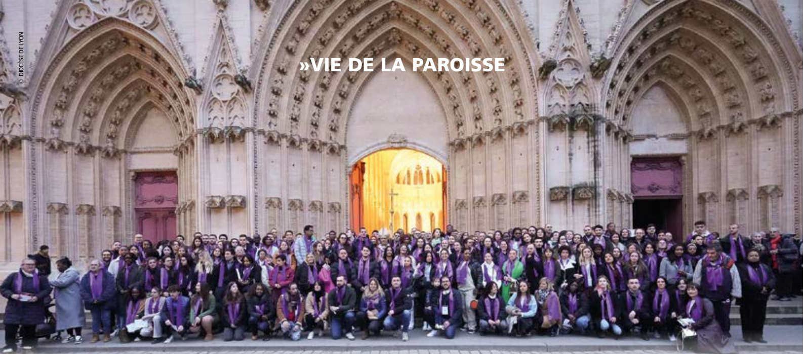
Les 228 catéchumènes du Diocèse lors de l'appel décisif du 18 février 2024.