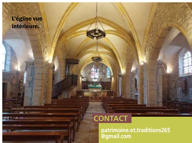
L'église vue intérieure.