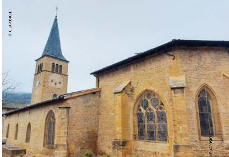
L'église, vue de l'extérieur.