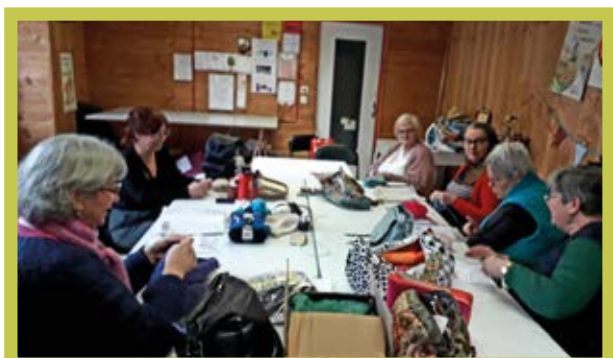
Lors d'un atelier.